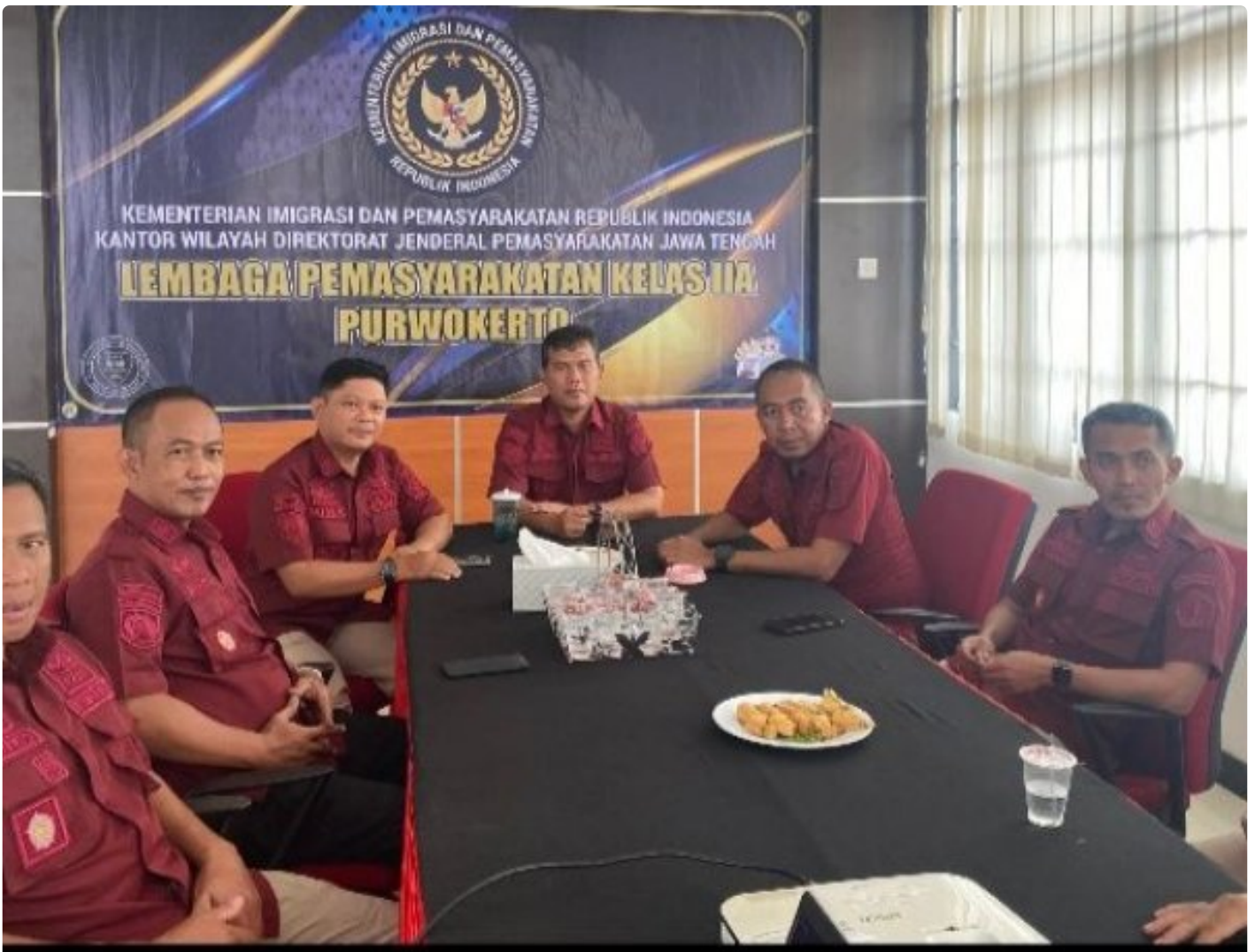
Lapas Purwokerto Ikuti Penguatan Kehumasan terkait Etika Penggunaan Media Sosial

PURWOKERTO Lembaga Pemasyarakatan (Lapas) Kelas IIA Purwokerto Mengikuti Secara Virtual Penguatan Kehumasan terkait Etika Penggunaan Media